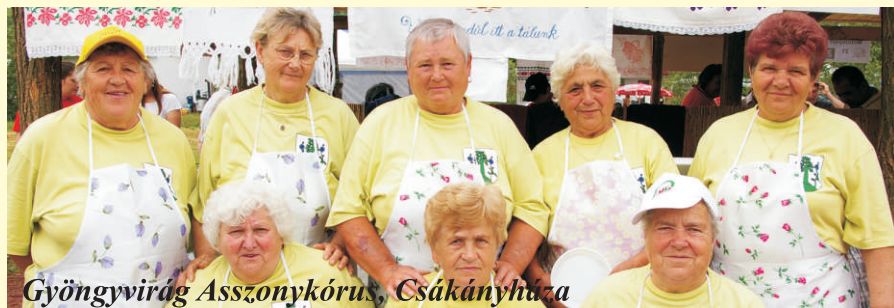
Gyöngyvirág Asszonykórus, Csákányháza

Miközben az összakarat folyamatosan kergette szemével, agyával az erőszakoskodó zord felhőket, a nap mindig ki-kisütött, mintegy erőt adva a főzőseregnek a kitartáshoz... Valóban, micsoda forgatag volt ez. Találó, nem egyszer szellemes csapatnevekkel álltak csatasorba a laskás, tócsnis főző tudósok. Olyan ízmesterek is megjelentek, akik különleges levessel, pörkölttel, vadból készült étellel próbálták