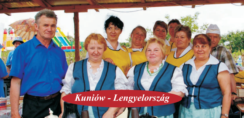
Kuniów - Lengyelország