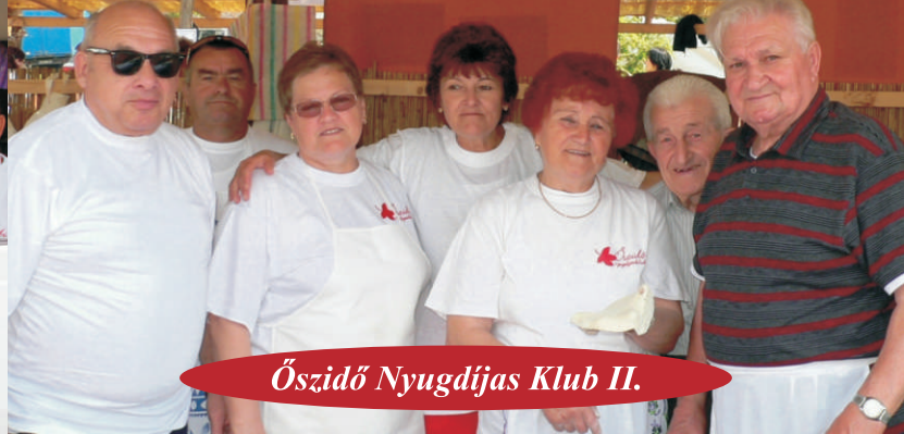
Őszidő Nyugdíjas Klub II.