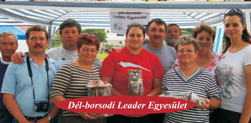
Dél-borsodi Leader Egyesület