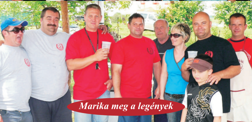
Marika meg a legények