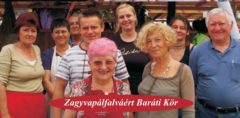
Zagyvapálfalváért Baráti Kör