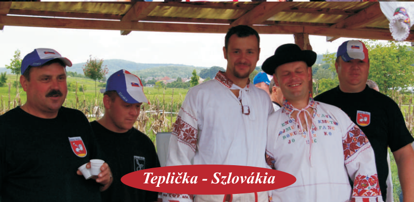
Teplička - Szlovákia