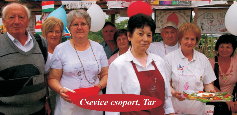
Csevice csoport, Tar