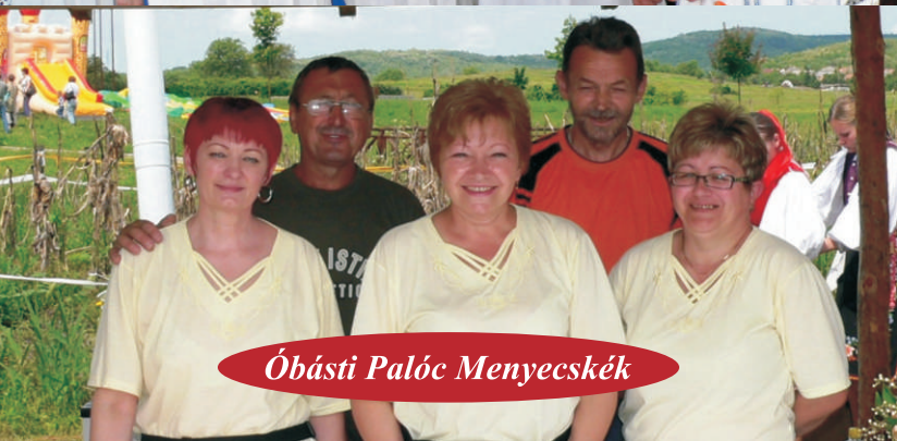
Óbásti Palóc Menyecskek