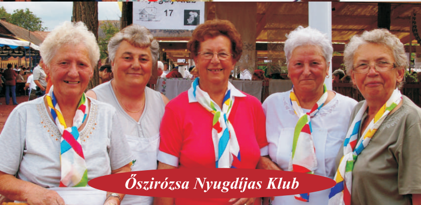
Őszirózsa Nyugdíjas Klub