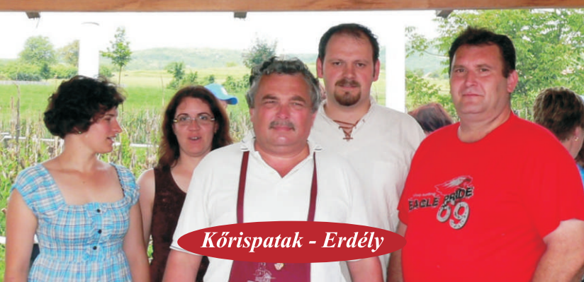
Kőrspatak - Erdély