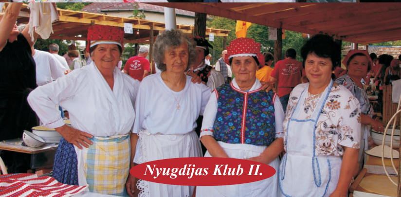
Nyugdíjas Klub II.