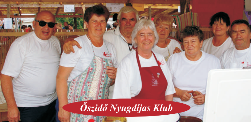
Őszidő Nyugdíjas Klub