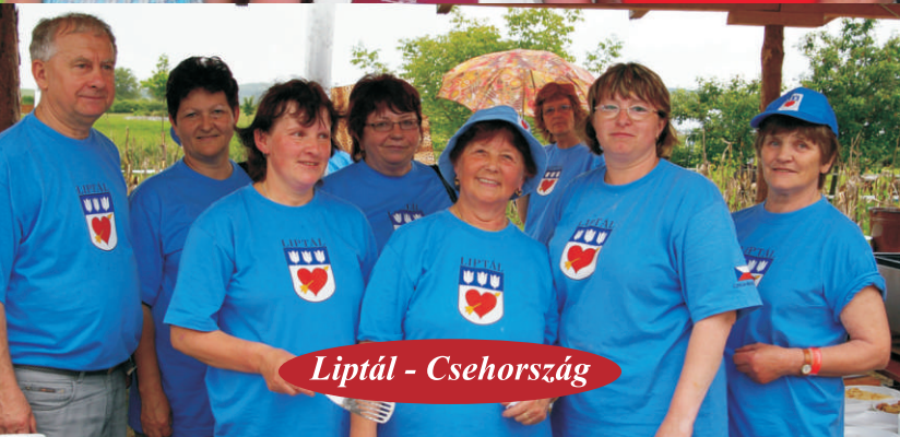
Liptál - Csehország