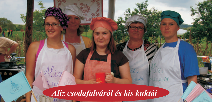
Alíz csodafalváról és kis kuktái