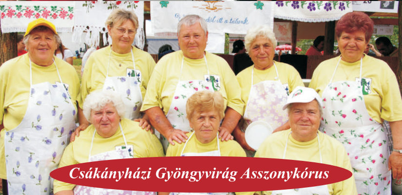
Csákányházi Gyöngyvirág Asszonykórus