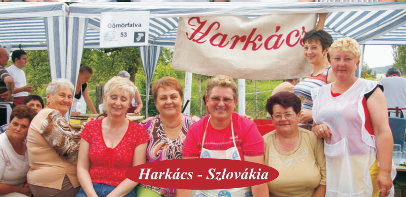
Harkács - Szlovákia