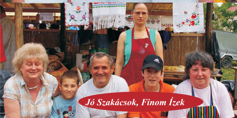
Jó Szakácsok, Finom Ízek